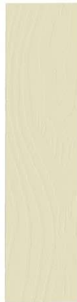
● 102 KALKHVID/GRÅ