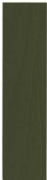
720 GRØN UMBRA