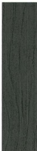
● 301 SORT IBENHOLT