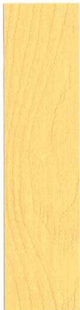
● 001 FARVELØS