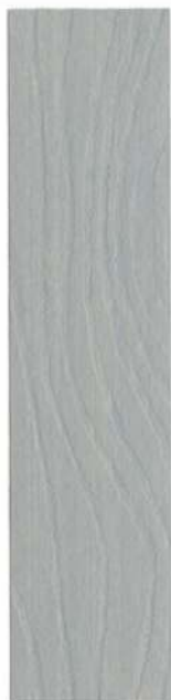
220 LYS GRÅ UMBRA