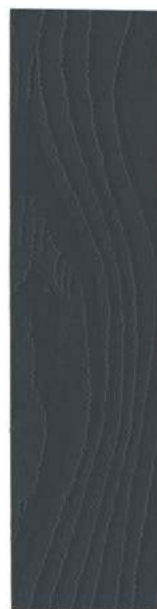
● 270 SKIFER