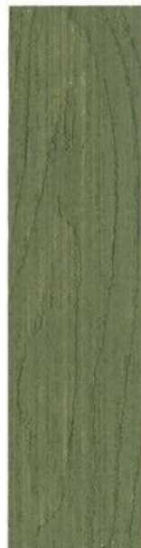
● 720 GRØN UMBRA