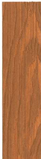
● 601 TEAK