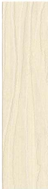
105 LYS LUD