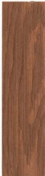
● 635 MAHOJNI