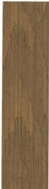
● 602 NØD