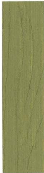
● 706 TRYKIMP. GRØN