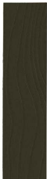
620 BRUN UMBRA