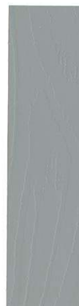
● 260 STENGRÅ