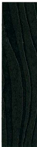
● 305 KULSORT