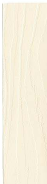
● 140 SNEBÆRVID