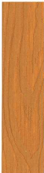
● 604 PINE