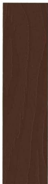
520 LYS DODENKOP