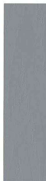
220 LYS GRÅ UMBRA