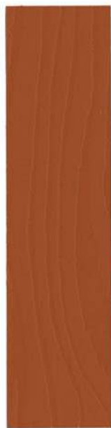
522 TEGL/LYS B. SIENNA