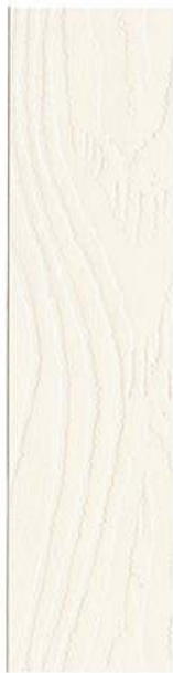
● 110 KRIDT